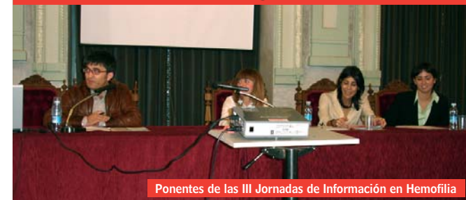
Ponentes de las III Jornadas de Información en Hemofilia

El 10 de noviembre la Asociación de Hemofilia de Burgos, celebrará sus IV Jornadas de Información en Hemofilia, bajo el título "REHABILITACIÓN: base fundamental del tratamiento en Hemofilia".