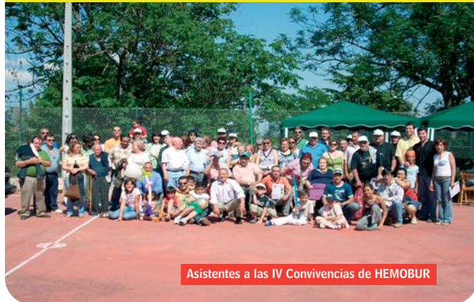
Asistentes a las IV Convivencias de HEMOBUR

Un año más llegó el momento de disfrutar de las convivencias de Hemobur y esta vez ha sido en el precioso pueblo burgalés de Poza de la Sal. El 23 de junio, acompañados de un magnífico tiempo, nos reunimos unas 80 personas de la familia burgalesa de la Hemofilia y amigos de diferentes puntos geográficos como Logroño, Madrid, Málaga o Valladolid, para pasar un día inolvidable.