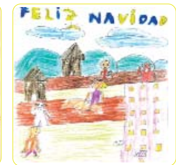
I PREMIO JUVENIL 2006 Autor: Alejandro Rebé (Burgos)