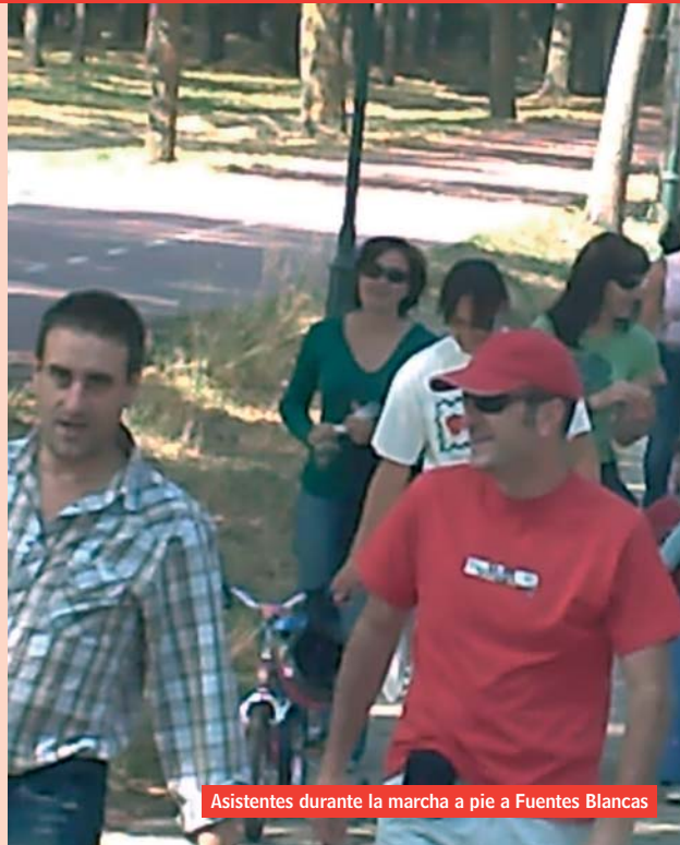
Asistentes durante la marcha a pie a Fuentes Blancas

Desde la Asociación de Hemofilia de Burgos se van a realizar diversas actividades entre el 15 de septiembre y el 16 de diciembre; todas ellas pensando en los hemofílicos, especialmente en los más pequeños.