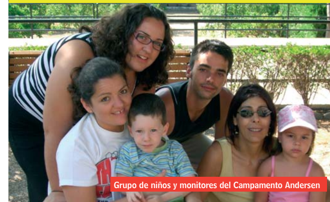
Grupo de niños y monitores del Campamento Andersen

El inhibidor es un anticuerpo que desarrolla el organismo del paciente hemofílico que neutraliza el efecto del tratamiento sustitutivo con factor VIII después de su administración por lo que es ineficaz y el paciente sigue con el proceso hemorrágico.